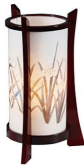
⑤民芸灯あやめ紫檀調 1対 ¥22,000- 高さ31cm×幅16cm