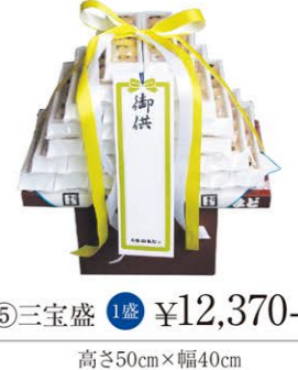
⑤ 三宝盛 1基 ¥12,370- 高さ50cm×幅40cm