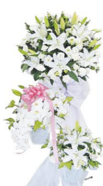
⑨ 全体イメージ(三段スタンド)