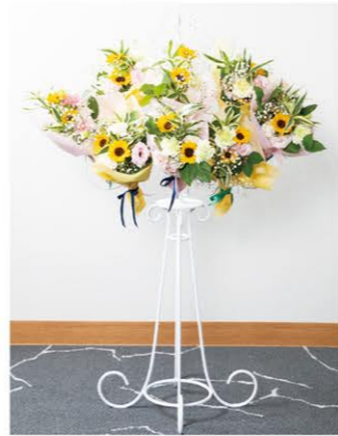
④ ありがとうブーケ (ブーケ8束入り) 1基 ¥22,000- 高さ130cm×幅70cm