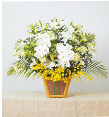
② 生花 1基 ¥22,000- 高さ80cm×幅80cm