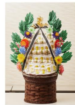
③ 菓子盛 1基 ¥16,500- ⑤高さ130cm×幅80cm