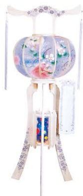
①水瀬本桐大(二段) 1対 ¥44,000- 高さ115cm×幅45cm

※仏教では古くから、お供え物には献花(花を手向けること)、献香(香を焚くこと)と並んで献灯が重要とされており、灯籠(とうろう)とは燭台と同じ灯供養具(とうくようぐ)、つまりは灯した明かりを御仏にお供する仏具なのです。なぜ供養に明かりが必要かというと、故人が極楽浄土へ旅立つ際の道しるべとして、灯籠に明かりを灯して成仏を祈ります。