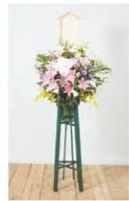
札付き+土台イメージ