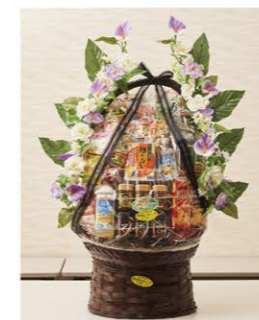
① 乾物盛 1基 ¥16,500- ①高さ130cm×幅80cm

※盛籠(もりかご)とは、葬儀・告別式などで祭壇の近くに置かれるお供え物のひとつで、果物や飲料、菓子などを籠に並べて、周りを造花で華やかに飾ったものです。故人にささげるお供え物、それから遺族に申意の気持ちを示すものとして贈られます。