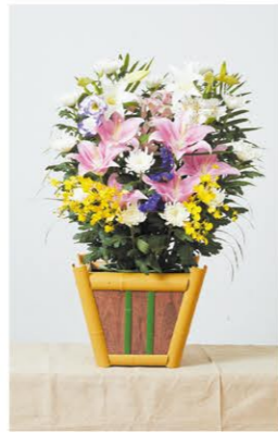
③ 生花 1基 ¥11,000- 高さ60cm×幅60cm