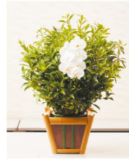
室内シキミ 1基 ¥16,500- 高さ65cm×幅65cm