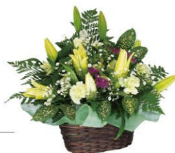
② 籠花 1籠 ¥11,000-