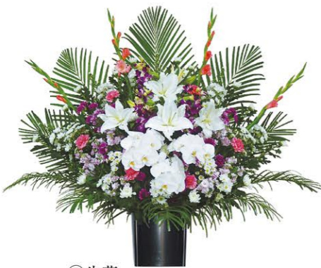
⑤ 生花 1基 ¥33,000- 高さ90cm×幅90cm