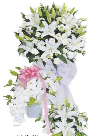
⑥ 生花 1基 ¥55,000- 高さ180cm×幅100cm