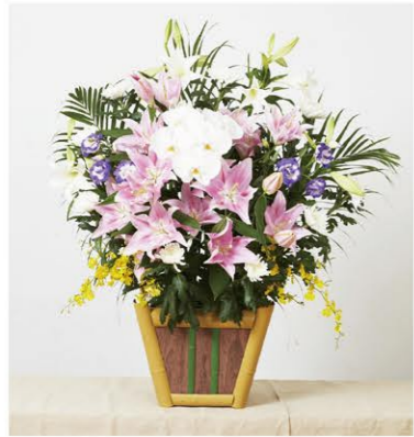
① 生花 1基 ¥16,500- 高さ70cm×幅70cm

※「供花」とは、故人に供えるお花のことを言います。これは死者の霊を慰めると同時に、祭壇・会場を飾る意味もあります。遺族や親族、故人と親しかった人などが贈るほか、遠方のため参列ができない人が贈ることがあります。また、香典辞退の葬儀であった場合に、香典の代わりに供花を贈ることもあります。