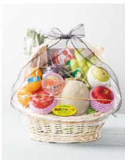
⑥ 果物バック 1セット ¥3,300-

※1対は2本、1基は1本です。※表示価格は全て税込(円)です。※季節によって、生花・盛籠の内容が一部変わる場合がございます。