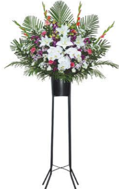
⑧ 全体イメージ(スタンド)