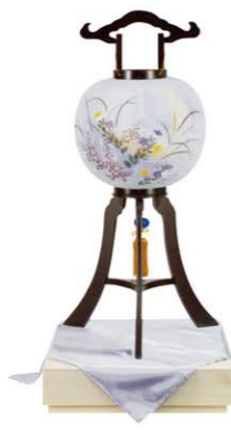
③桔梗ボカシ細二重尺一紫檀調 1対 ¥55,000- 高さ82cm×幅33cm