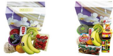
⑦ 乾物・果物バック 1セット ¥4,950-

※1対は2本、1基は1本です。※表示価格は全て税込(円)です。※季節によって、生花・盛籠の内容が一部変わる場合がございます。