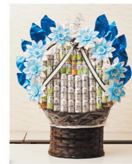
④ ビール盛 1基 ¥16,500- 高さ130cm×幅80cm