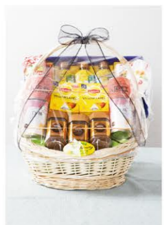
⑤ 果物バスケット (手提げ籠)