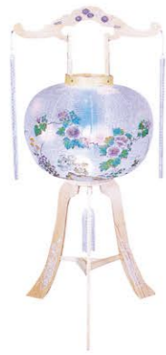
②白峰尺二 1対 ¥27,500- 高さ90cm×幅36cm