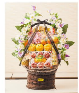
② 果物盛 1基 ¥16,500- ②高さ130cm×幅80cm